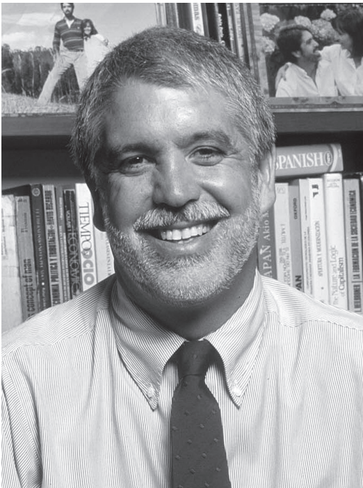
Enrique Peñalosa President of the Board of Directors, ITDP (Institute for Transportation and Development Policy) Former Mayor, Bogotá, Colombia BMW Guggenheim Lab Advisor Max size 4"x5" at 300 dpi.