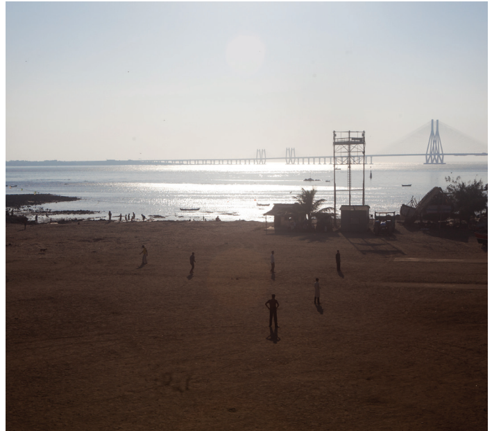
BMW Guggenheim Lab Mahim Beach, Mumbai