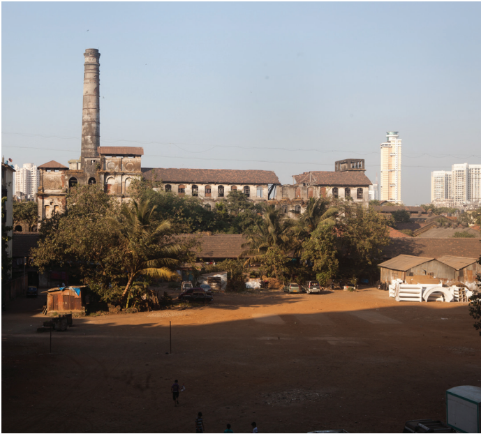
BMW Guggenheim Lab Batliboy Compound, Mill Worker Colony, Mumbai