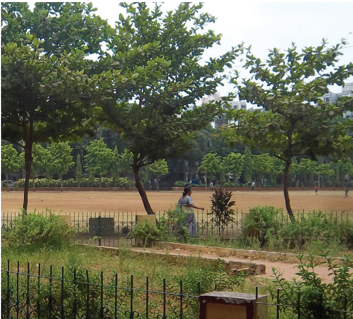
BMW Guggenheim Lab Sambhaji Park (Mulund East), Mumbai