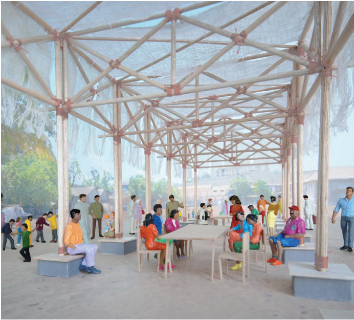
BMW Guggenheim Lab Architect's Model, satellite site