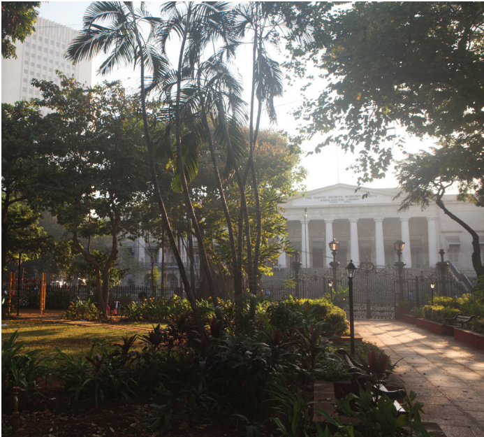
BMW Guggenheim Lab Horniman Circle, Mumbai