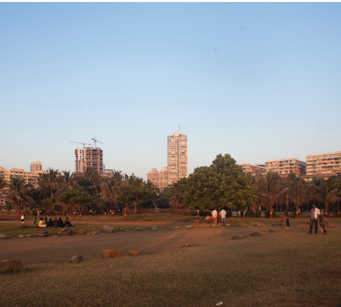
BMW Guggenheim Lab Priyadarshini Park, Mumbai